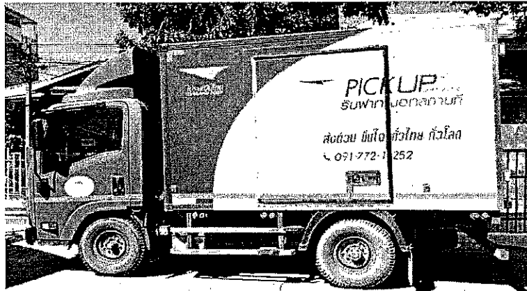
หมายเลขทะเบียน 82-8906 เชียงใหม่