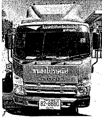
หมายเลขทะเบียน 82-8680 เชียงใหม่